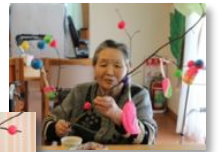
きれいに出来たね～