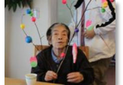
小正月 だんご木作りをしました