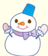
皆さんの作品です