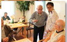
お誕生日会をしました