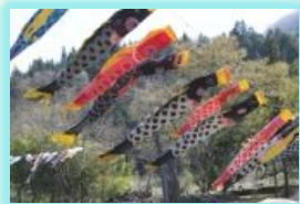
高瀬の川浴いに 豪快なこいのぼり