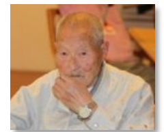
リハビリは楽しい レクリエーションで